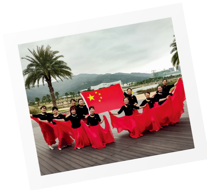
新家園社區居家養老服務中心開設“楓葉藝術”旗袍舞蹈班，豐富社區長者的文娛生活。