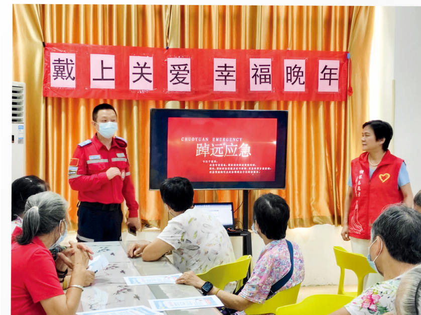
新家園社區居家養老服務中心長者參加平安一鍵通緊急呼援設備使用培訓。