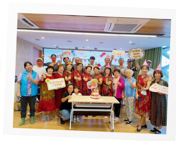
小橫琴社區居家養老服務中心舉辦長者生日會。