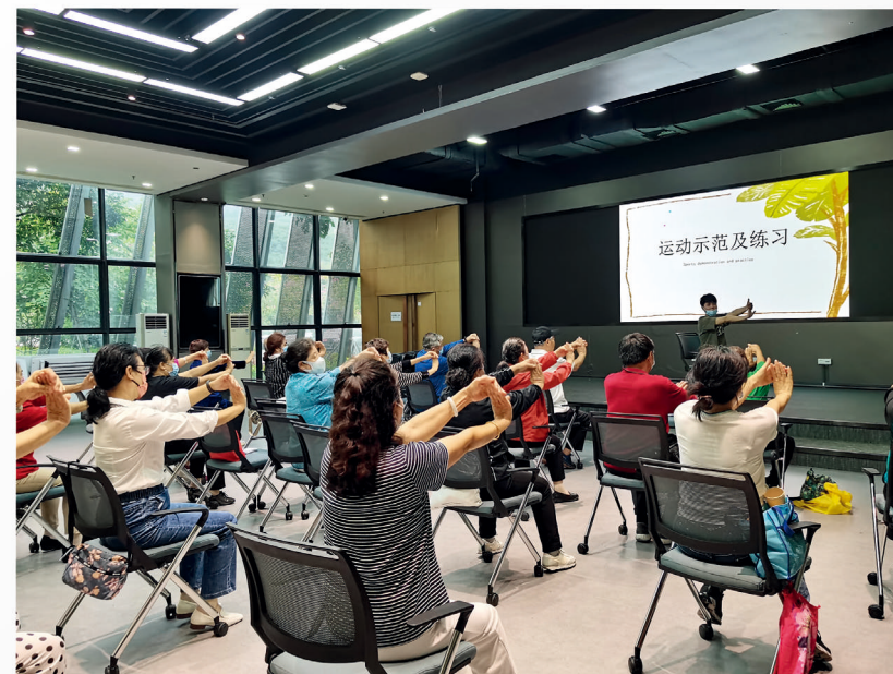
蓮花社區居家養老服務中心開展長者健康系列講座，專業的康復治療師帶領長者進行健康拉伸運動。