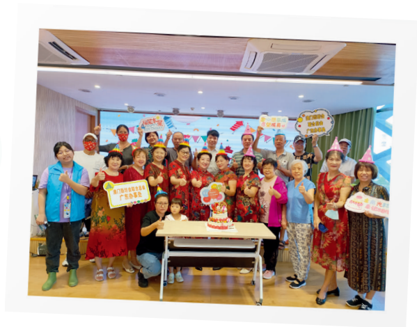
小横琴社区居家养老服务中心举办长者生日会。