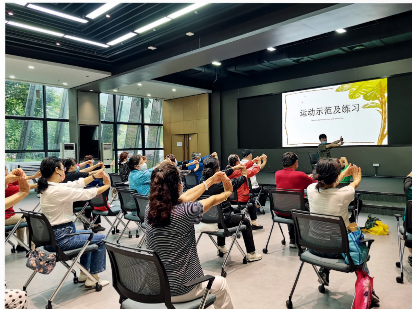
莲花社区居家养老服务中心开展长者健康系列讲座，专业的康复治疗师带领长者进行健康拉伸运动。