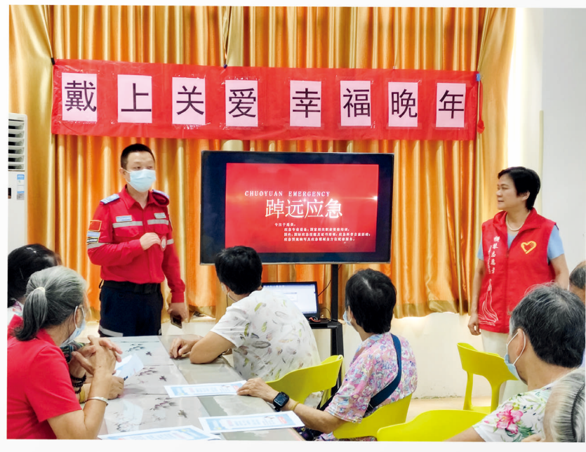
新家园社区居家养老服务中心长者参加平安一键通紧急呼援设备使用培训。