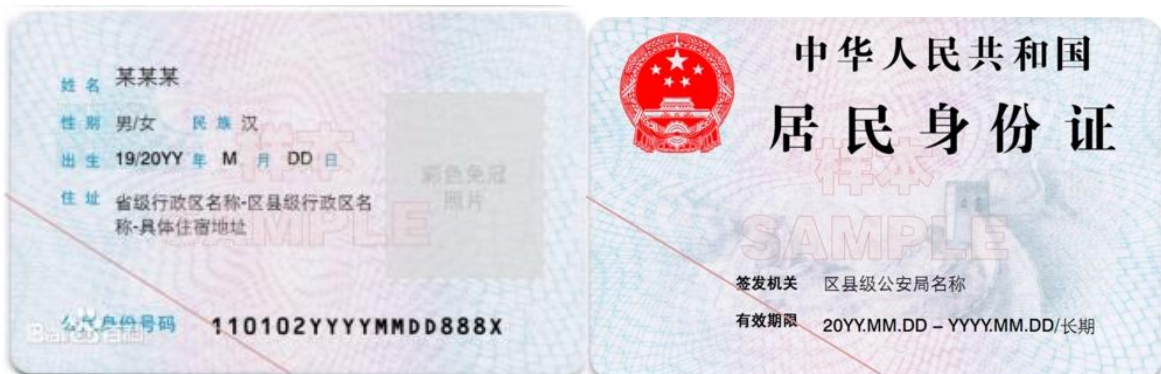
图 2 身份证明示例